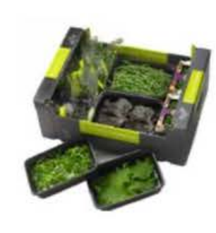
VEI60 5 vaschette Assortimento "Sapore di mare"