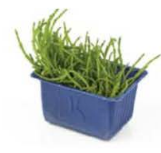
VE079 12 vaschette Salicornia single cress (disponibilità giu-sett)