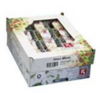
VE070 12 vaschette Shiso mix single cress