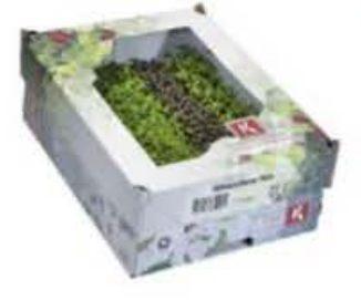
VE098 12 vaschette Whatznew mix single cress