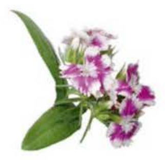
VE044 vaschetta da 30 fiori Garofano dei poeti