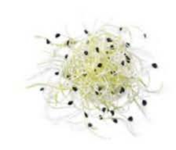
VE191 50 g - 8 vaschette Porro germogli