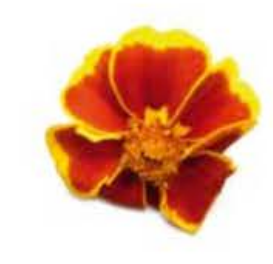
VEO41 vaschetta da 15 fiori Garofano d'India