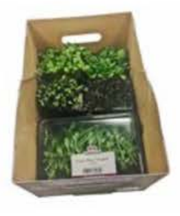
VE172 5 vaschette Assortimento "Autunno"