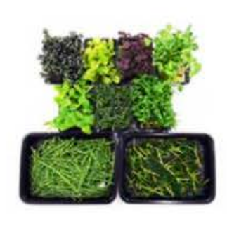
VEI30 15 vaschette Assortimento crescioni