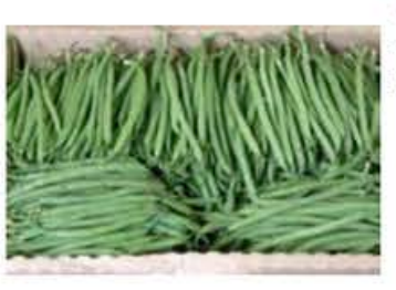
VEO34 2 kg Fagiolini finissimi