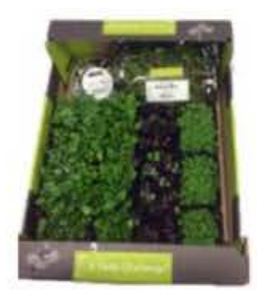
VE185 14 vaschette Assortimento "Halloween"