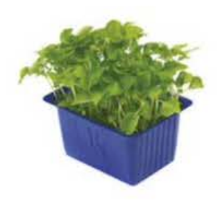
VE077 12 vaschette Sechuan single cress