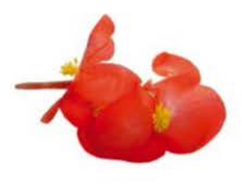
VE048 vaschetta da 20 fiori Begonia