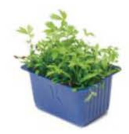
VE189 12 vaschette Motti cress