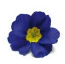
VE049 vaschetta da 15 fiori Primula (disponibilità gen-mag)