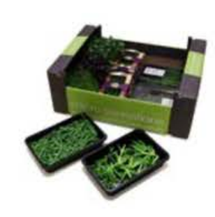
VEI62 10 vaschette Assortimento "Primavera"