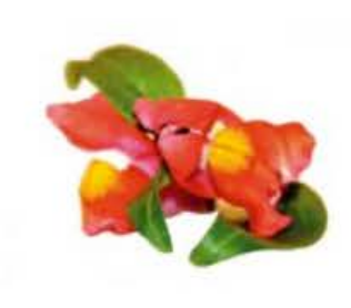
VE047 vaschetta da 15 fiori Bocca di leone