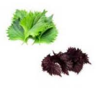
VE071 12 vaschette Mix foglie Shiso