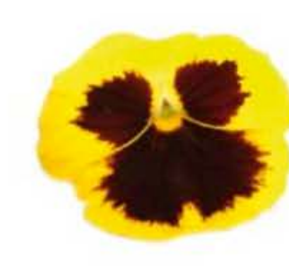
VE045 vaschetta da 10 fiori Viola del pensiero (disponibilità annuale con riserva nel periodo estivo)