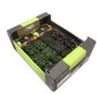
VE154 14 vaschette Assortimento "Christmas Tasty"