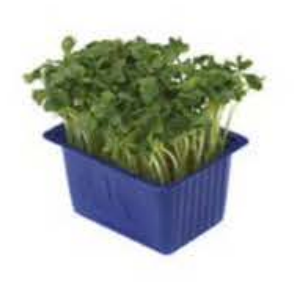
VE076 18 vaschette Daikon cress