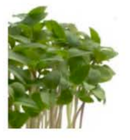
VE166 16 vaschette Basil cress thai