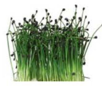
VE126 18 vaschette Rock chives