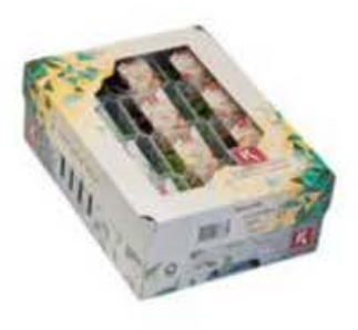
VE075 12 vaschette Sakura mix single cress