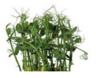
VE074 12 vaschette Affilla cress