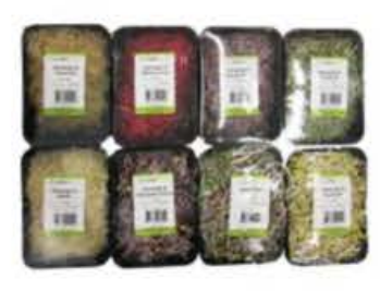
VE040 8 vaschette Misto di germogli