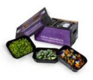
VE145 conf. da 5 vaschette Mix Estivo Fiori e Crescioni (disponibilità giu-set)