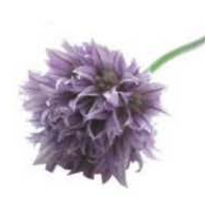
VE043 8 vaschette da 10 fiori Fiori di cipollina (disponibilità mar-giu)