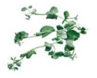
VE143 2 vassoi da 100 g Salad pea