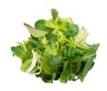
VE067 200 g Soncino mix