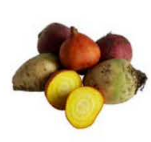
VEO2O 5 kg Bietole (Navet) Arcobaleno