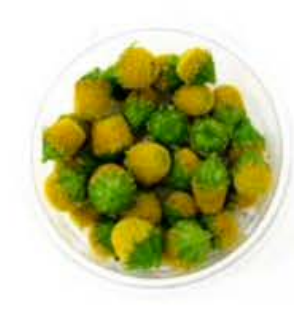
VE083 vaschetta da 30 fiori Sechuan Buttons (Fiore Elettrico)