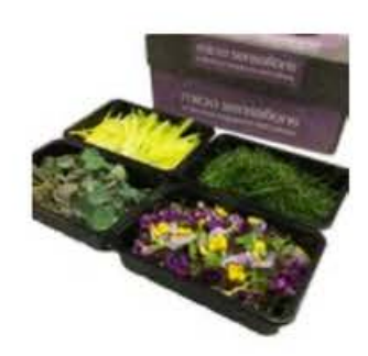
VE199 4 vaschette The possibilities box mix