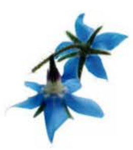
VE046 vaschetta da 30 fiori Borragine